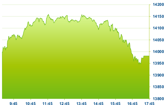
DAX (předchozí den)

Mezi nejvíce rostoucí akciové tituly indexu DAX patřily akcie společností Merck (+2,8 %), HelloFresh (+2,3 %) a Siemens (+2,3 %). Naopak nejvíce ztrátové byly Hannover Rueck SE (-3,1 %), Deutsche Bank (-1,4 %) a Daimler Truck Holding AG (-1,2 %).